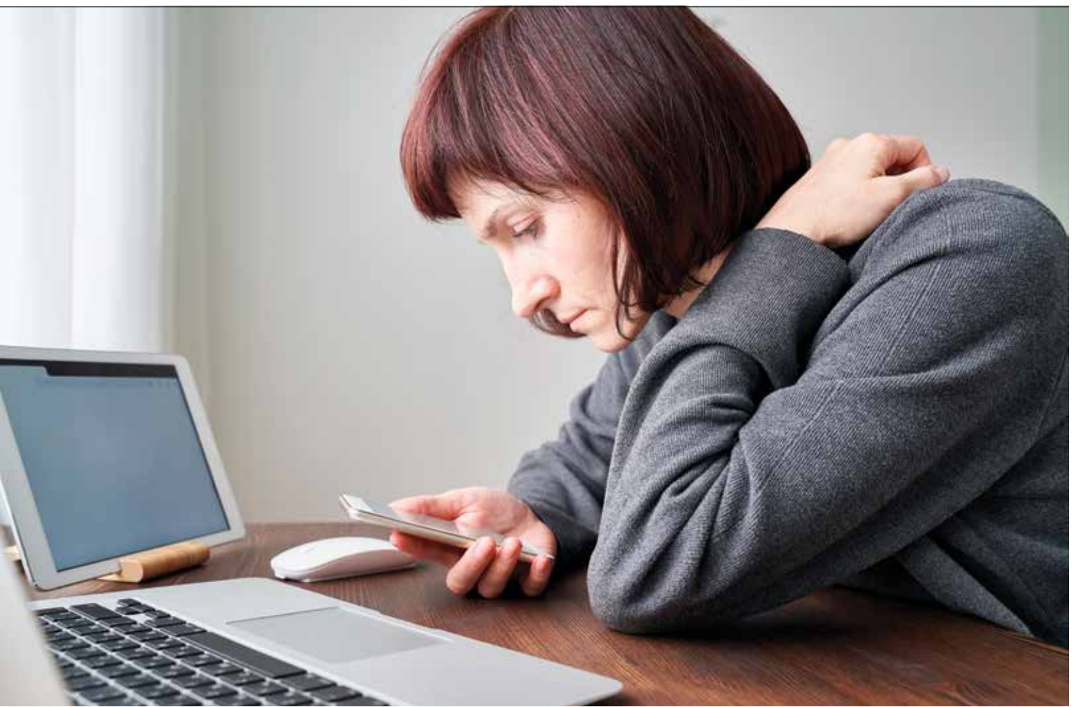
Het beeld bestaat dat voornamelijk ouderen 'digibeet' zijn, maar ook een deel van de jongeren en jongvolwassenen heeft een gebrek aan 'digitale slagkracht'.

Het netwerk staat wel ernstig onder druk door bezuinigingen.