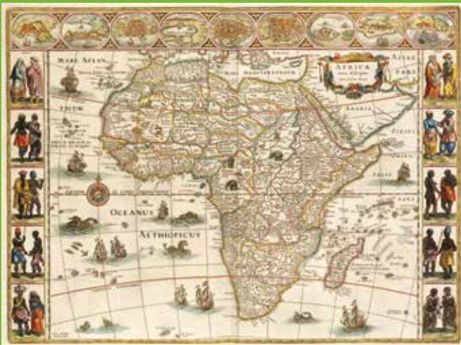
Afrika uit het achtste deel van de Grooten Atlas van Joan Blaeu (Amsterdam 1664).