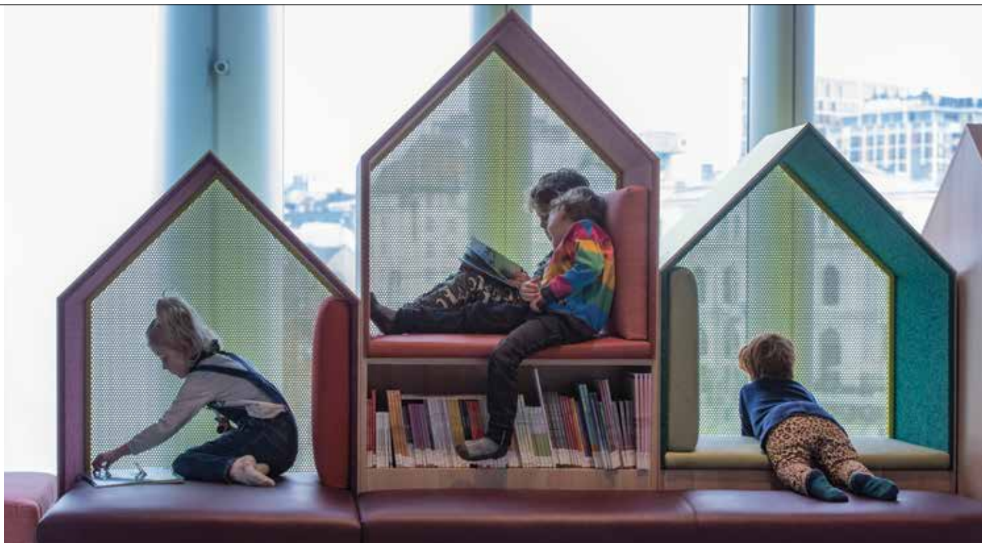
Het kindergedeelte bevindt zich op de tweede verdieping en biedt verschillende activiteiten voor kinderen.

armoede, ongelijkheid, achterstand, discriminatie en laaggeletterdheid te bestrijden. De bibliotheek is er om mensen die moeite hebben met lezen en schrijven te helpen. Zij is er om de integratie van nieuwkomers te stimuleren. De bibliotheek is er niet voor sommigen, maar voor iedereen. Dat roept meteen de discussie op in hoeverre de bibliotheek ruimte moet bieden aan alle stemmen en opvattingen? De bibliotheek is een symbool van de democratie, maar moet zij tevens platform zijn voor extreemlinkse of -rechtse geluiden? Wij vinden van wel, zolang die geluiden passen binnen het raamwerk van de wet. Sommige medewerkers en bezoekers hebben moeite met die zienswijze, maar ook in dat opzicht is de bibliotheek een afspiegeling van de maatschappij.'