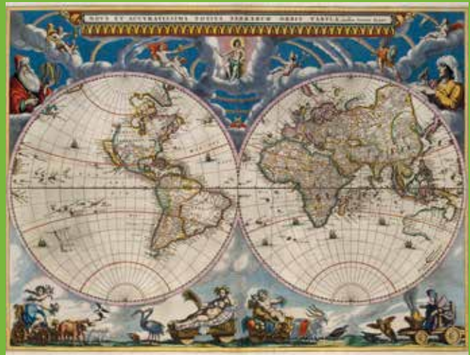
Wereldkaart uit het eerste deel van de Grooten Atlas van Joan Blaeu (Amsterdam 1664).