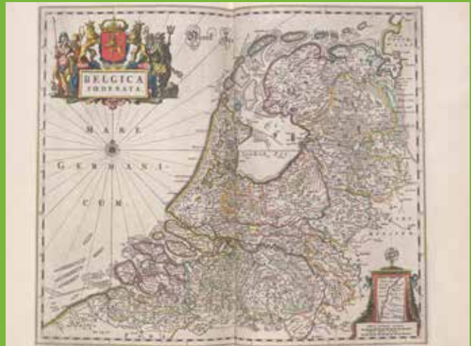
De Republiek in het derde deel van de Grooten Atlas van Joan Blaeu (Amsterdam 1664).