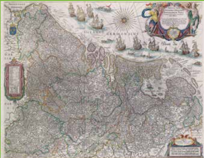
De Nederlanden in het derde deel van de Grooten Atlas van Joan Blaeu (Amsterdam 1664).