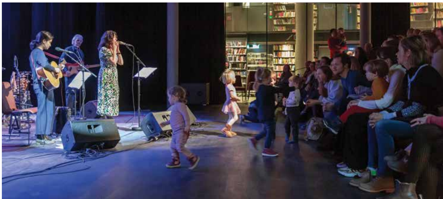
In het souterrain bevindt zich een auditorium met tweehonderd zitplaatsen voor grotere evenementen.